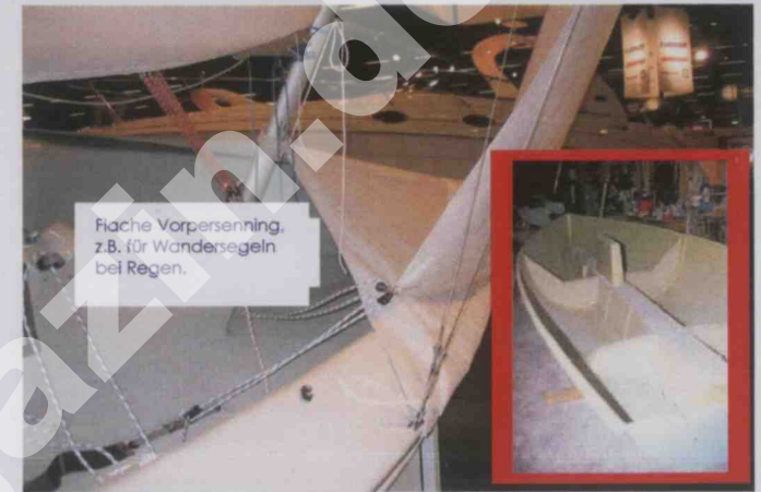
Flache Vorpersening, z.B. für Wandersegeln bei Regen.

Ausführliche Testberichte aus Segelmagazinen und weitere Informationen zur c55 gibt es auf der Homepage www.biehlmarin.com .